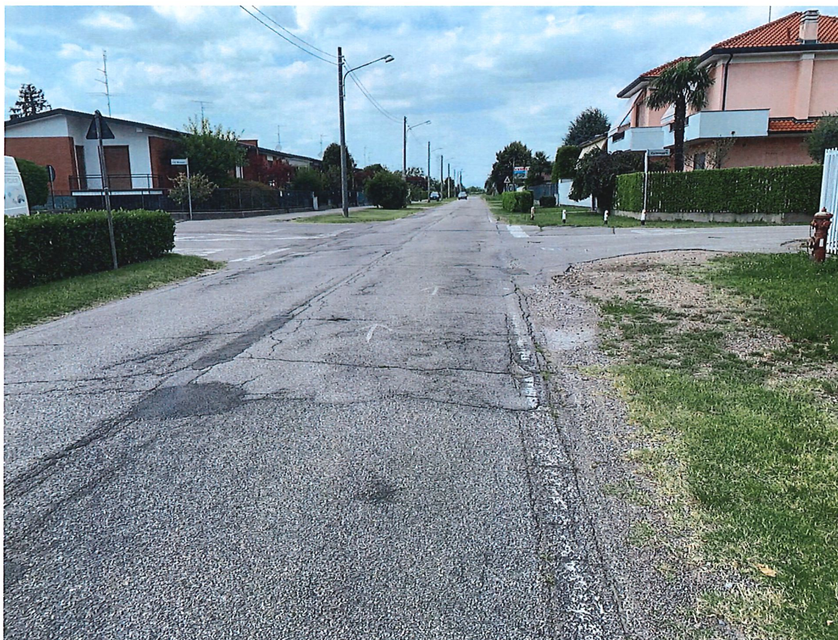
INCROCIO DI VIA CAVOUR E VIA CARAVAGGIO

Città Metropolitana di Milano Settore Governo e Sviluppo del Territorio