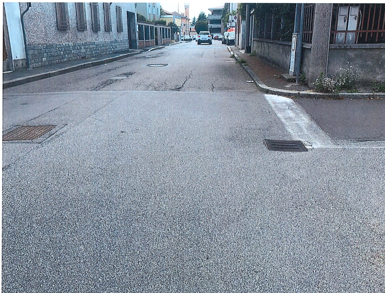
VIA PALESTRO – SOLO DA VIA MARCORA FINO AL PARCHEGGIO SCUOLE

Città Metropolitana di Milano Settore Governo e Sviluppo del Territorio