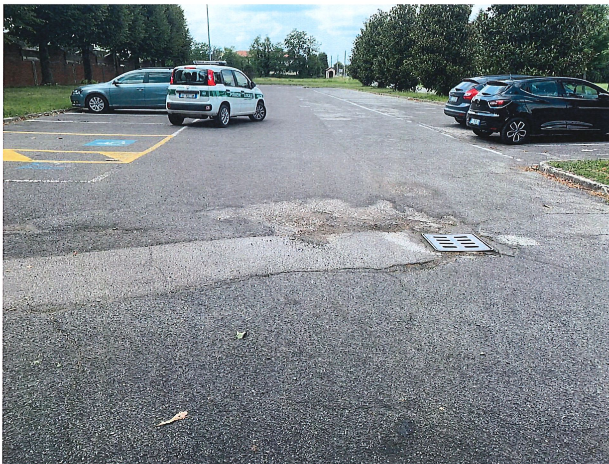
PARCHEGGIO CIMITERO – INVERUNO

Città Metropolitana di Milano Settore Governo e Sviluppo del Territorio