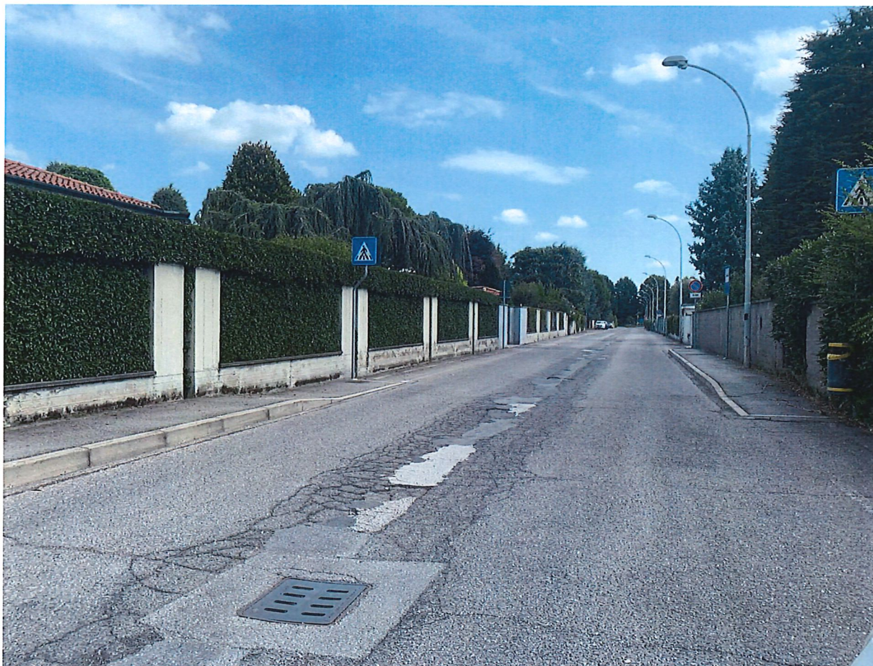
VIA EINAUDI – SOLO PARTE CENTRALE

Città Metropolitana di Milano Settore Governo e Sviluppo del Territorio