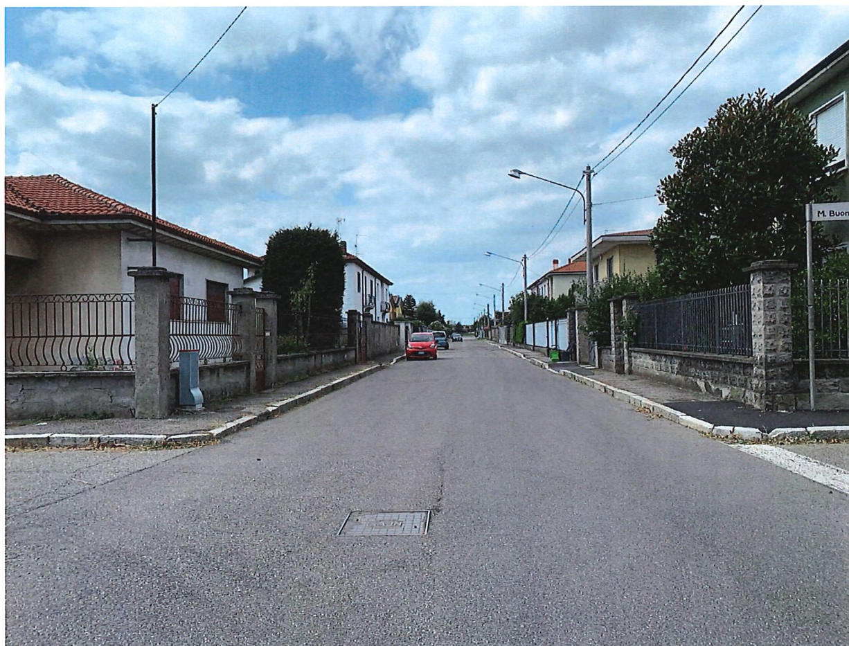
VIA VENETO (ENTRAMBI I LATI) DA VIA BUONARROTI A VIA CIMABUE

Città Metropolitana di Milano Settore Governo e Sviluppo del Territorio