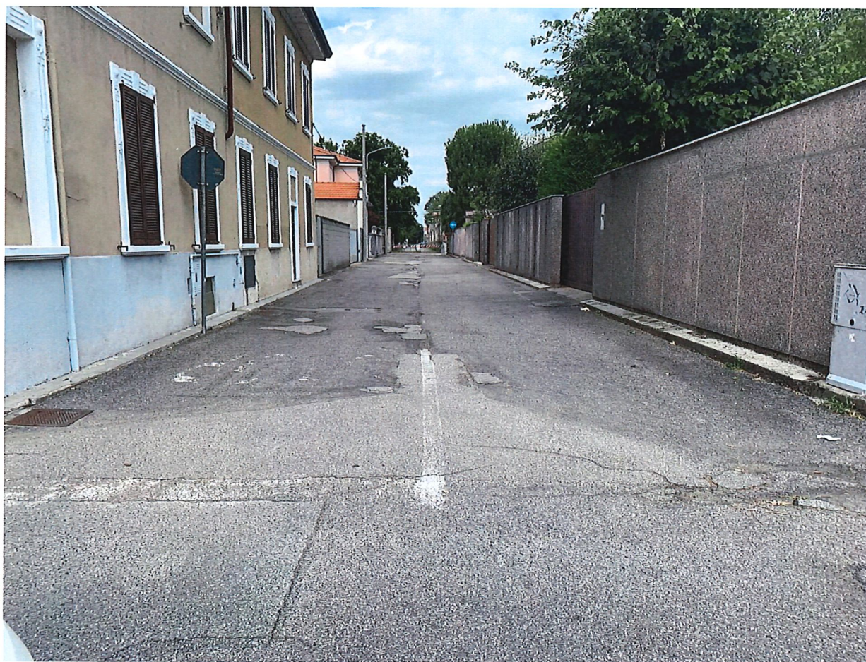
VIA BELLOLI – DA VIA VENETO A VIA IV NOVEMBRE

Città Metropolitana di Milano Settore Governo e Sviluppo del Territorio