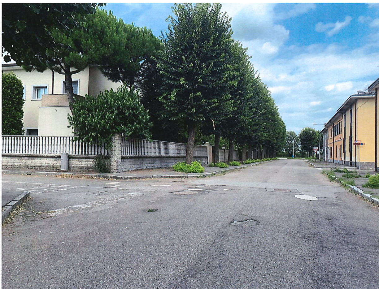
INCROCIO DI VIA PIAVE CON VIA MADONNA IMMACOLATA

Città Metropolitana di Milano Settore Governo e Sviluppo del Territorio